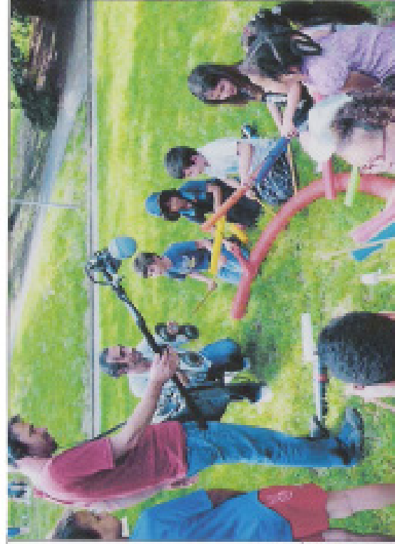
Le CD de la Tribu Hérisson sera distribué aux habitants du quartier à partir du 5 décembre.

"Nous avons construit de petites pistes de 2 à 4 minutes qui racontent la vie du quartier par la voix de ses habitants. Les habitants des années quatre-vingt la scène du président Mitterrand... Nous avons le témoignage d'une femme qui l'a accueilli